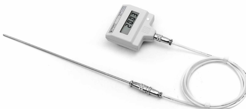
Рисунок 2 – Внешний вид термометра модификаций -Н, -Т, -Ф с разъемным соединением датчика температуры к электронному блоку с помощью кабеля-удлинителя