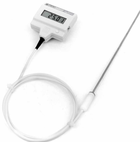
Рисунок 3 – Внешний вид термометра модификаций -Н, -Н-ТС, -Т, -Ф с неразъемным соединением датчика температуры к электронному блоку

Пломбирование термометров не предусмотрено.